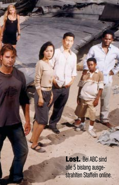
Lost. Bei ABC sind alle 5 bislang ausgestrahlten Staffeln online.

ten mehr als unsicher ist. Gehört Streams aus den USA daher die Zukunft? Kurzfristig vielleicht. Walter Karban, der Mann hinter noTraxx , sieht das allerdings nüchtern: „Wenn Tauschbörsen abgedreht werden, werden Streaming-Lösungen wohl ebenfalls unter Druck geraten. Die Macht der Medienkonzerne ist einfach zu groß.“